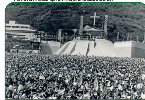
Imagem histórica da missa celebrada em 1980 pelo Papa João Paulo II, em Belo Horizonte