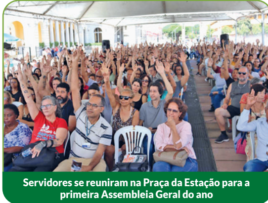
Servidores se reuniram na Praça da Estação para a primeira Assembleia Geral do ano