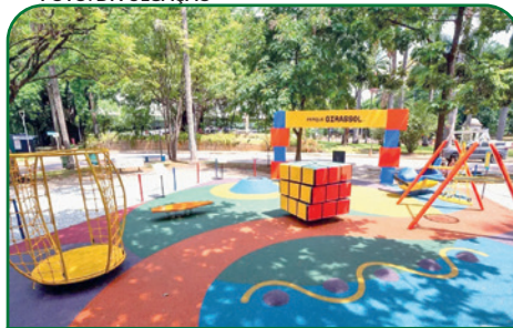
Parque Girassol, localizado no Parque Municipal Américo Renné Giannetti