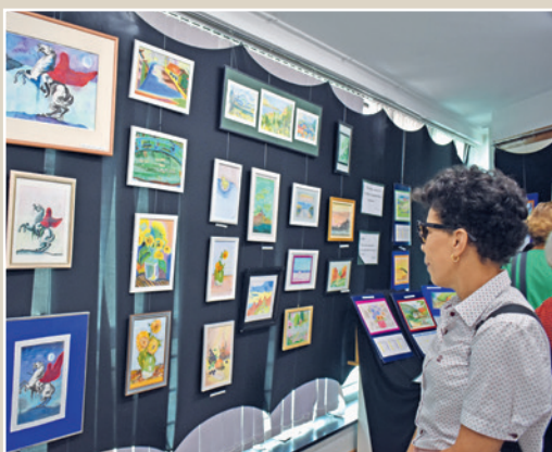
Trabalhos foram produzidos a partir de diferentes técnicas