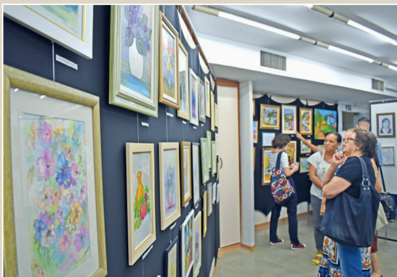
Obras de desenho e pintura foram expostas no ateliê do 9º andar