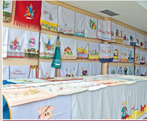
Toalhas, panos de prato e caminhos de mesa entre os trabalhos de Pintura em Tecido