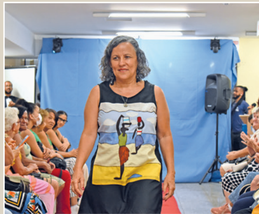
Algumas peças foram inspiradas em obras de arte de grandes pintores