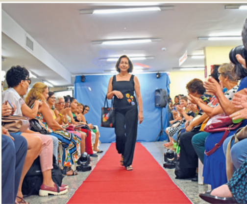
Roupas e acessórios foram customizados pelas próprias alunas