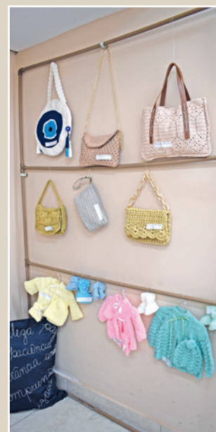
Peças produzidas pelas alunas de Tricô, Crochê e Bordado