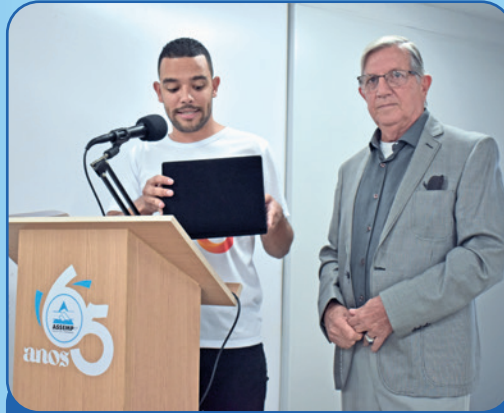
Parceira da Assemp há quase 30 anos, Unimed-BH prestou homenagem à Associação

E m um evento que reuniu membros da Presidência, conselheiros, colaboradores, parceiros e associados, a Assemp comemorou no dia 1º de março seu aniversário de 65 anos. Uma celebração marcada por homenagens, agradecimentos e apresentações artísticas.