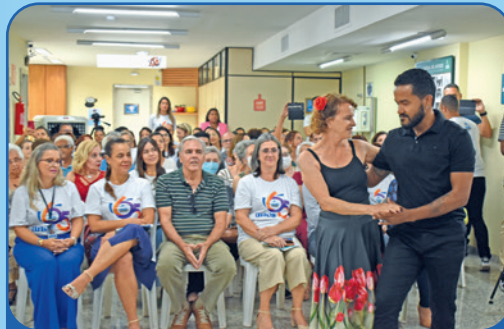
Alunas e professores do curso de dança de salão fizeram uma apresentação especial