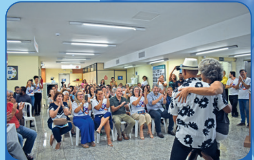
Público se encantou e se emocionou com as surpresas preparadas para a celebração dos 65 anos