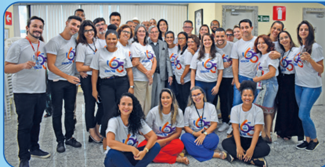
Parte da equipe que ajuda a construir diariamente essa história de sucesso da Assemp