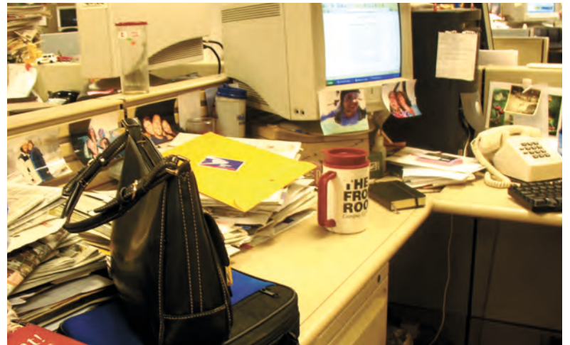
Crédito: Maggie Jumps